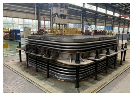
杜瓦超大矩形波纹管

ITER杜瓦超大矩形波纹管的研制成功，标志着我国大型非标波纹管设计研发技术已进入世界前列，为未来聚变堆设计建造以及核电大型设备等领域，需求大型复杂截面多层波纹管的设计研发及工艺探索奠定了坚实的基础。